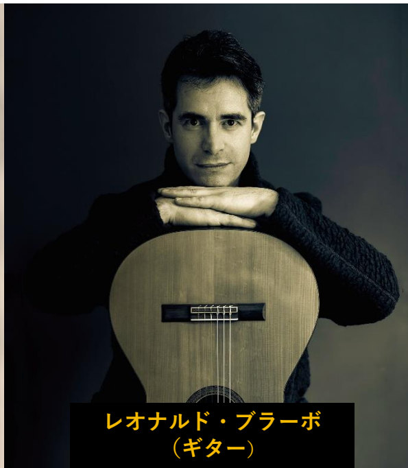
レオナルド・ブラーボ (ギター)